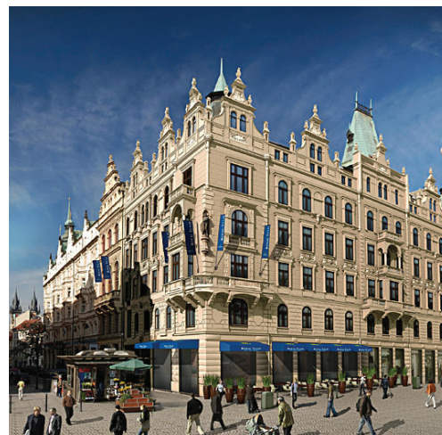
hotel Republica Praha