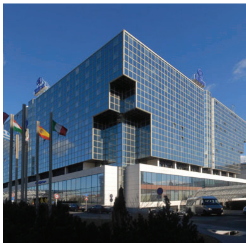
hotel Hilton Praha