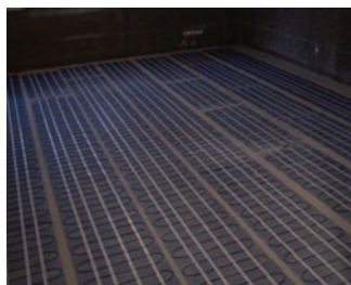
instalace topné rohože HM