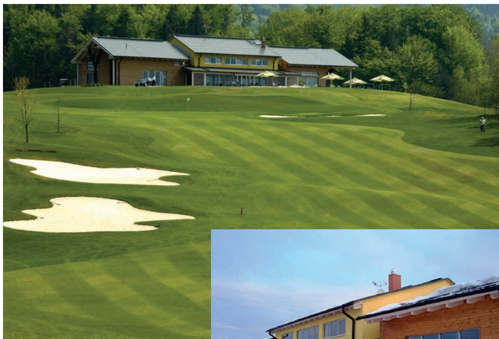
Golf Resort Liberec